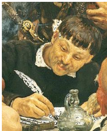
Д.Яворницький – писар

На обкладинці копія знаменитої картини І.Ю. Рєпіна «Запорожці пишуть листа турецькому султанові». Д.І. Яворницький позував художнику при створенні образу писаря.