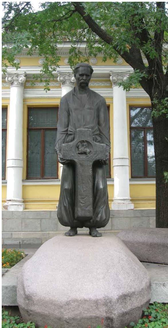
Пам'ятник Д.І. Яворницькому біля Історичного музею, м. Дніпропетровськ