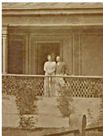
Фрагмент попередньої фотографії